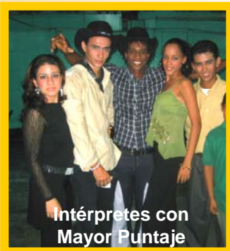
Intérpretes con Mayor Puntaje

A través de los conciertos, la SEJUVE promociona a los finalistas del festival